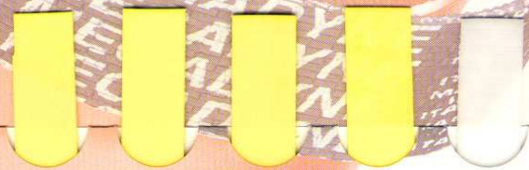
P 110 P 120 P 102 P 0 S 110 Elastik ohne Trägermaterial

MEGAFLAT lets are truly endless mandrel produced available in both polyurethane or chloroprene rubber, with either polyester, cotton or aramid reinforcements. Megafat belts are particularly suitable for both power transmission and conveying.